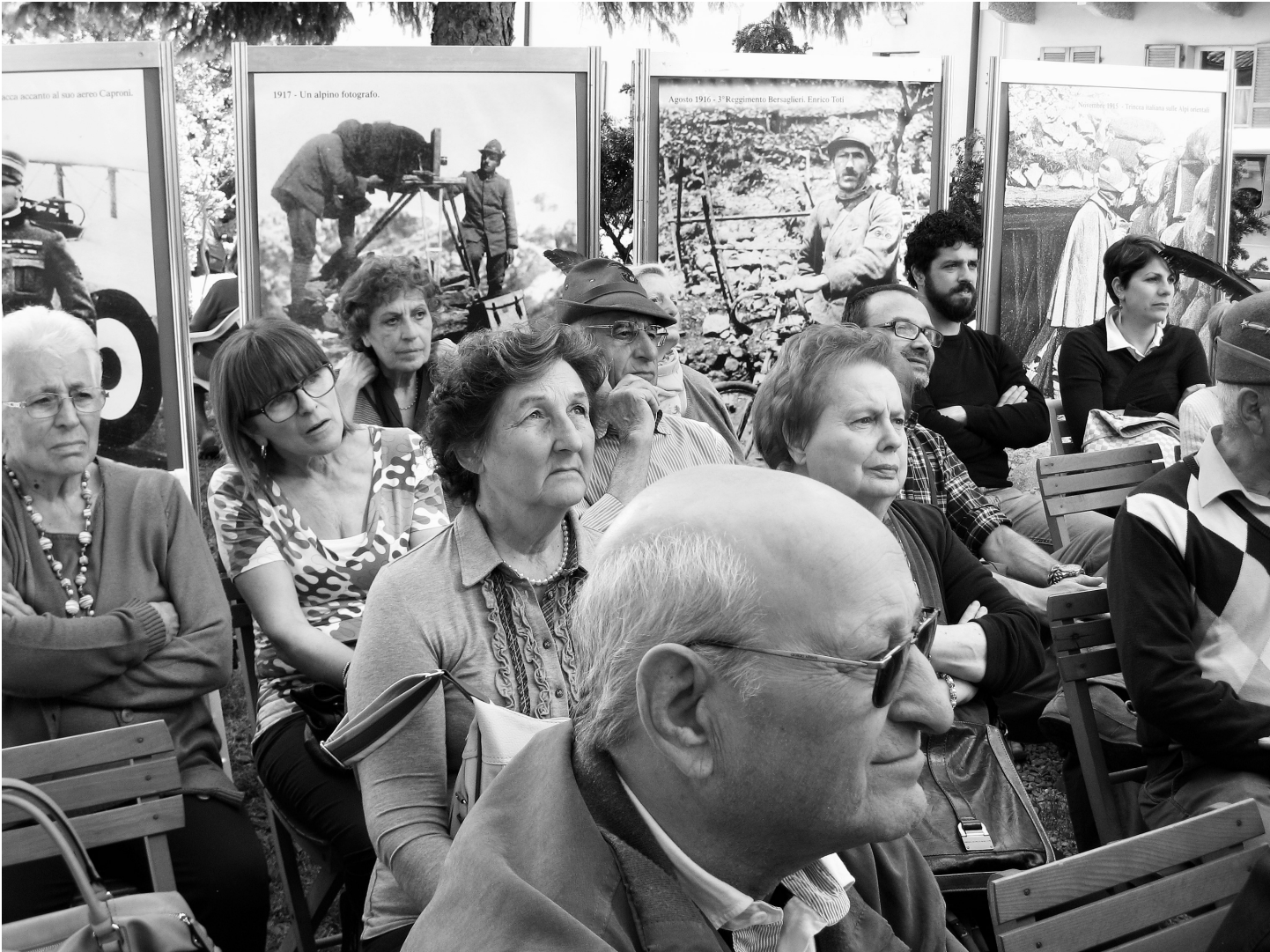
...acca accanto al suo aereo Caproni.